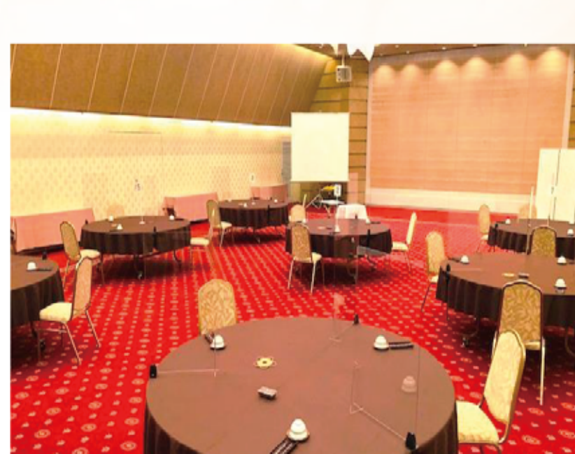
写真：2F 淀の間/円卓 (直径2m) 3名掛け/7卓