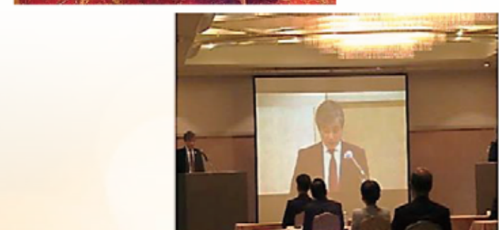
オンライン開催での関西財界セミナーの様子