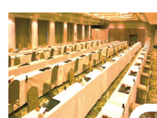
アクリルボード 設置状況